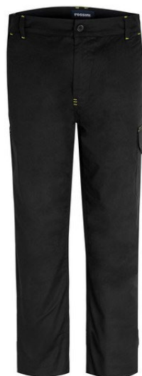
01 - BLEU