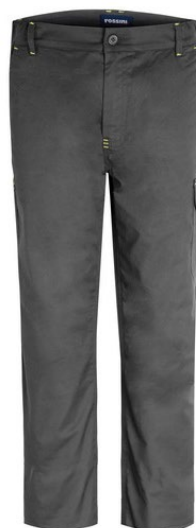
12 - GRIS