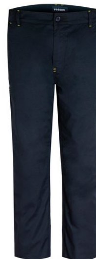
05 - NOIR