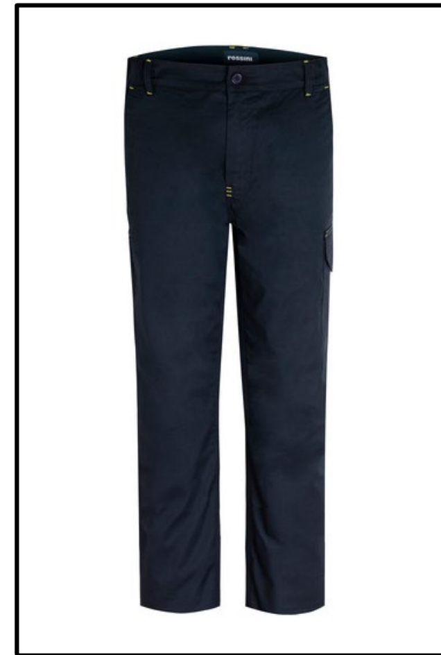
01 - BLEU