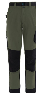
04 – VERT