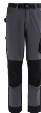
12 – GRIS