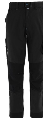
05 – NOIR