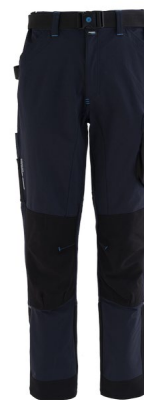
01 – BLEU