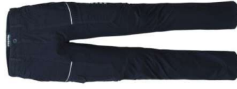
01 - BLEUMARIN