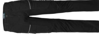
05 - NEGRU